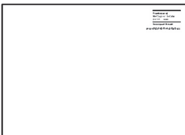
Placering liggande försändelse